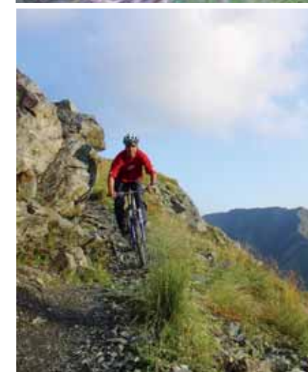
WEGE, WO SICH ZIEGEN UND BIKER TREFFEN