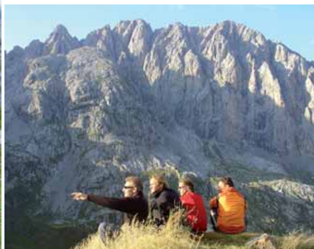
DIE BUBEN UND DER BERG