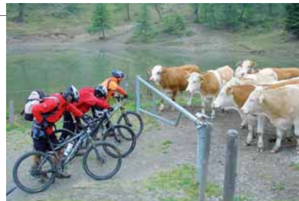
KÜHE SIND IN GROSSEN GRUPPEN EIN ERNSTZUNEHMENDES HINDERNIS

Wer der Meinung ist, dass Radfahren unbedingt mit fahren zu tun hat, der irrt. Wer glaubt, dass eine Bike-Tour nur mit karger Kost, energetisierenden Säften und Riegeln und harten Betten zu tun hat, der irrt ebenfalls.