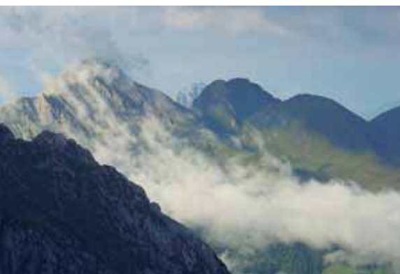
AKUTES NEBELREISSEN UND SCHNELL AUFRUISSENDE WOLKEN VOM PLOCKENPASS HERAUF