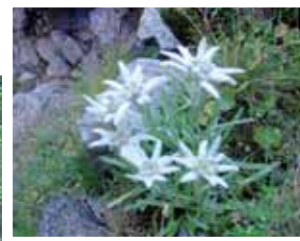
UND WENN DU GLAUBST, ES GEHT NICHT MEHR, KOMMT URPLÖTZLICH EIN EDELWEISS DAHER