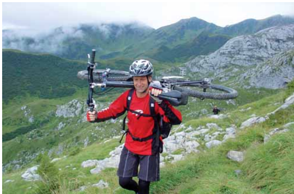
DER GEIST SAGT ABSTEIGEN. DER KÖRPER STEIGT AB.